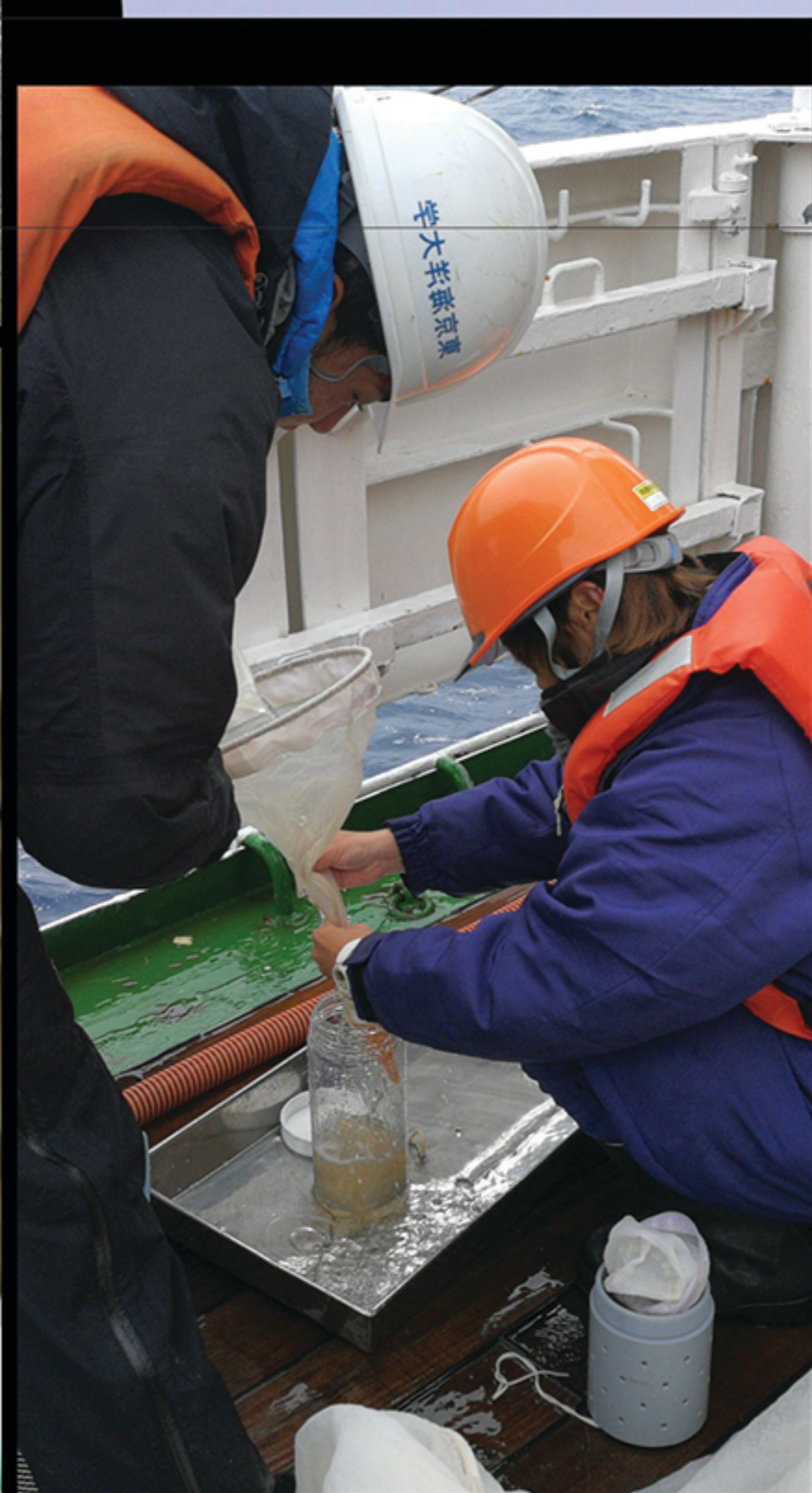
เก็บตัวอย่างไมโครพลาสติกที่ผิวน้ำทะเล