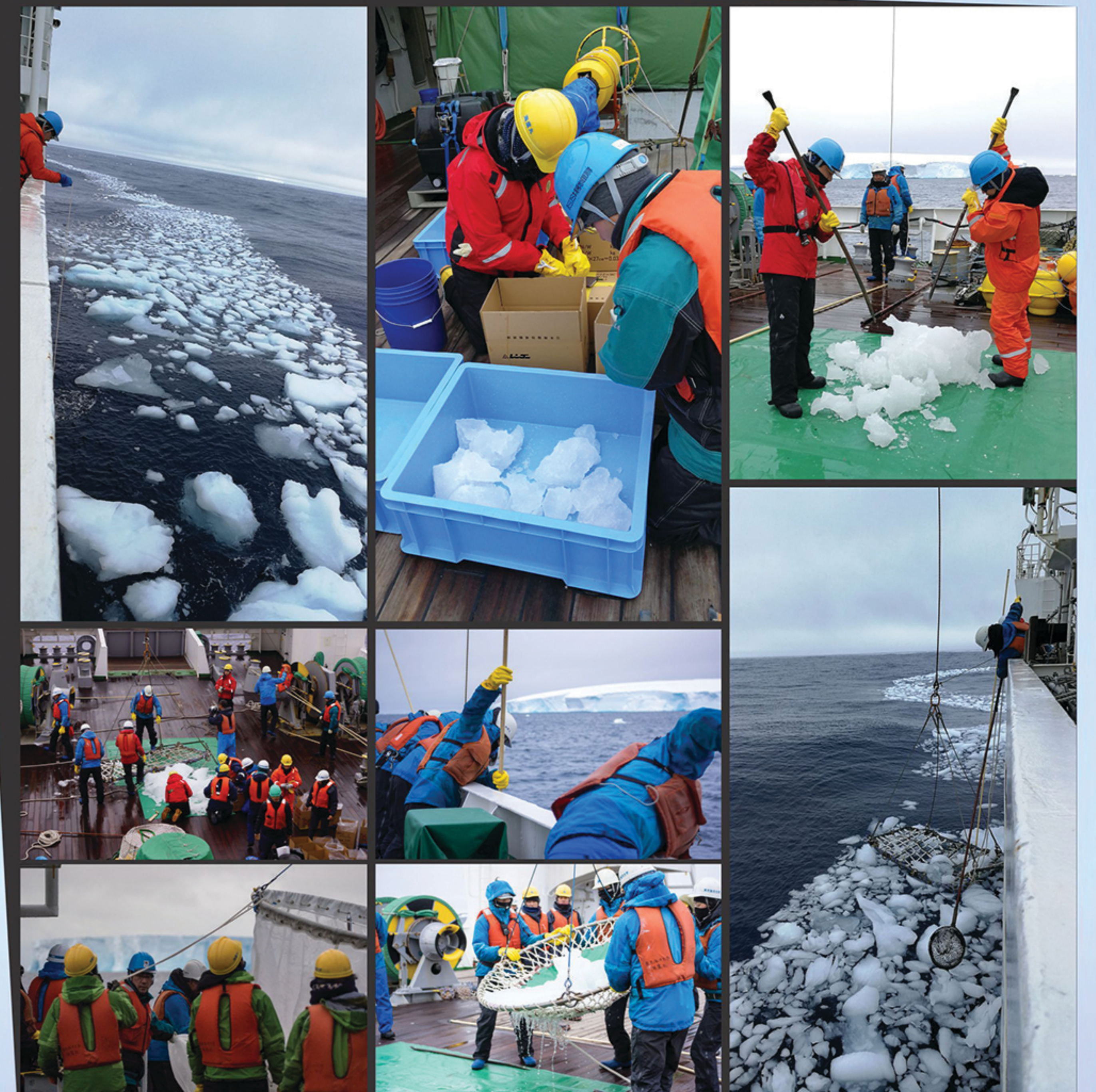
เก็บตัวอย่าง Sea ice เพื่อใช้ในการศึกษา องค์ประกอบของสิ่งมีชีวิตใน sea ice