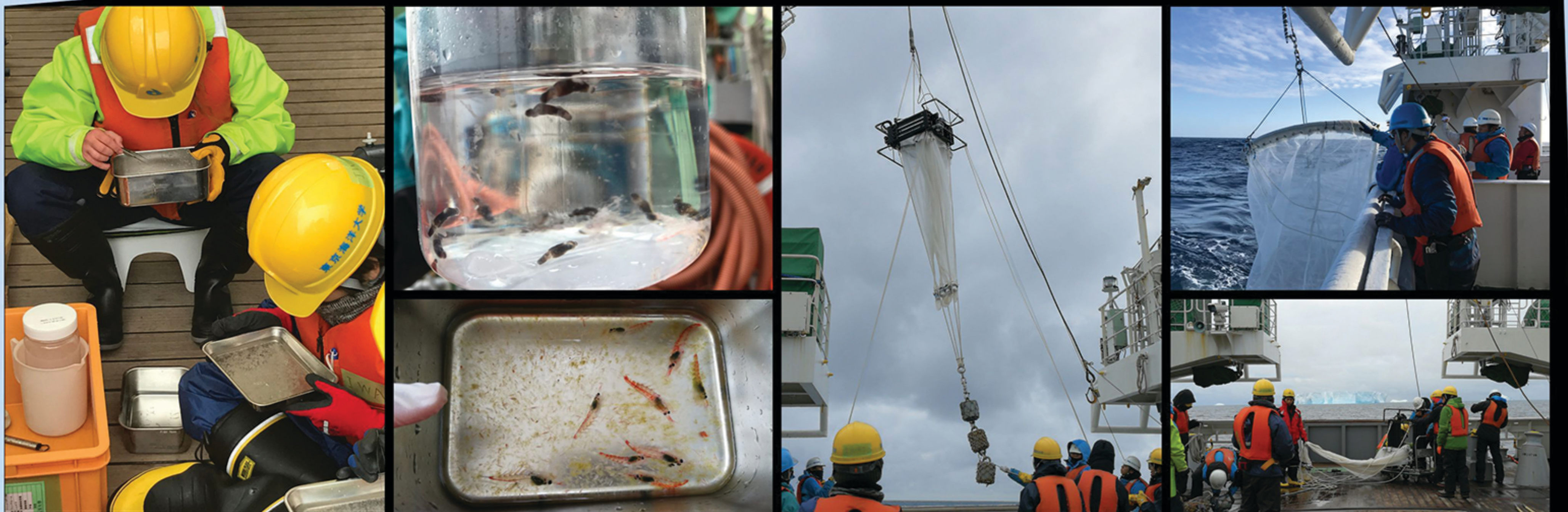
เก็บตัวอย่างแพลงก์ตอนพืชและสัตว์