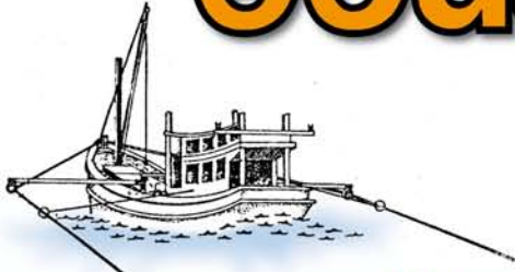
อวนลากแคระ

อวนลาก เป็นเครื่องมือประมงที่ใช้ฉนวนลักษณะคล้ายถุง แล้วใช้เรือลากจูงให้เคลื่อนที่ไปข้างหน้าอย่างต่อเนื่องในการจับสัตว์น้ำ อวนลากเป็นเครื่องมือที่ใช้จับสัตว์น้ำที่อาศัยอยู่กับบริเวณพื้นทะเลหรือเหนือพื้นทะเล ซึ่งมีทั้งชนิด ที่อยู่รวมกันเป็นฝูง หรือแพร่กระจายเป็นบริเวณกว้าง ขณะทำการประมงสัตว์น้ำที่อยู่หน้าปากอวนจะถูกกวาด ต้อนให้เข้าไปรวมกันที่ก้นถุง ซึ่งเป็นส่วนท้ายสุดของอวน ในการลากอวนจำเป็นต้องมีอุปกรณ์หรือวิธีการที่ช่วย ให้ปากอวนกางหรือต่างออก วิธีที่นิยมใช้กันแพร่หลายมีอยู่ 3 วิธีคือ ใช้เรือสองลำ ใช้แผ่นตะเฒ่าและใช้คันไม้ชัก อวนลากหน้าดินในประเทศไทยแบ่งตามวิธีการทำประมงออกเป็น 4 ชนิดคือ อวนลากคานท่า อวนลากแผ่นตะเฒ่า อวนลากแคระ และอวนลากคู่