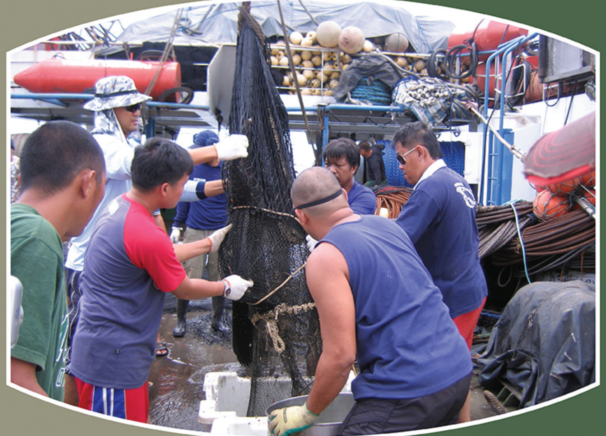
Deep-sea exploration at Gulf, Philippines onboard the M.V. DA-BFAR in May 2008

การผลิตและเผยแพร่ข้อมูลสู่สาธารณชน PRODUCTION AND DISSEMINATION OF INFORMATION PACKAGE