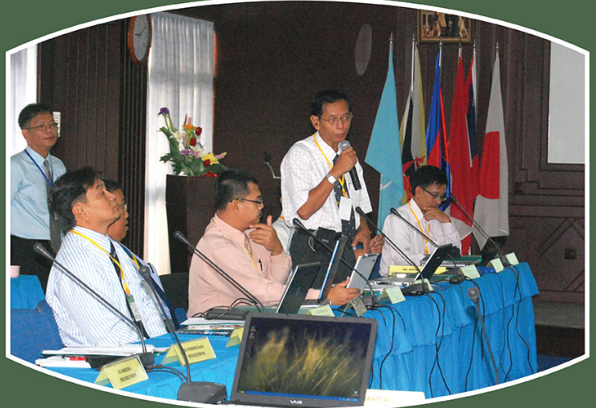
Workshop on standard operation procedures (SOP) on the methodologies for deep-sea fishery exploration and development & improvement of appropriate sampling gear on 26-28 May 2009