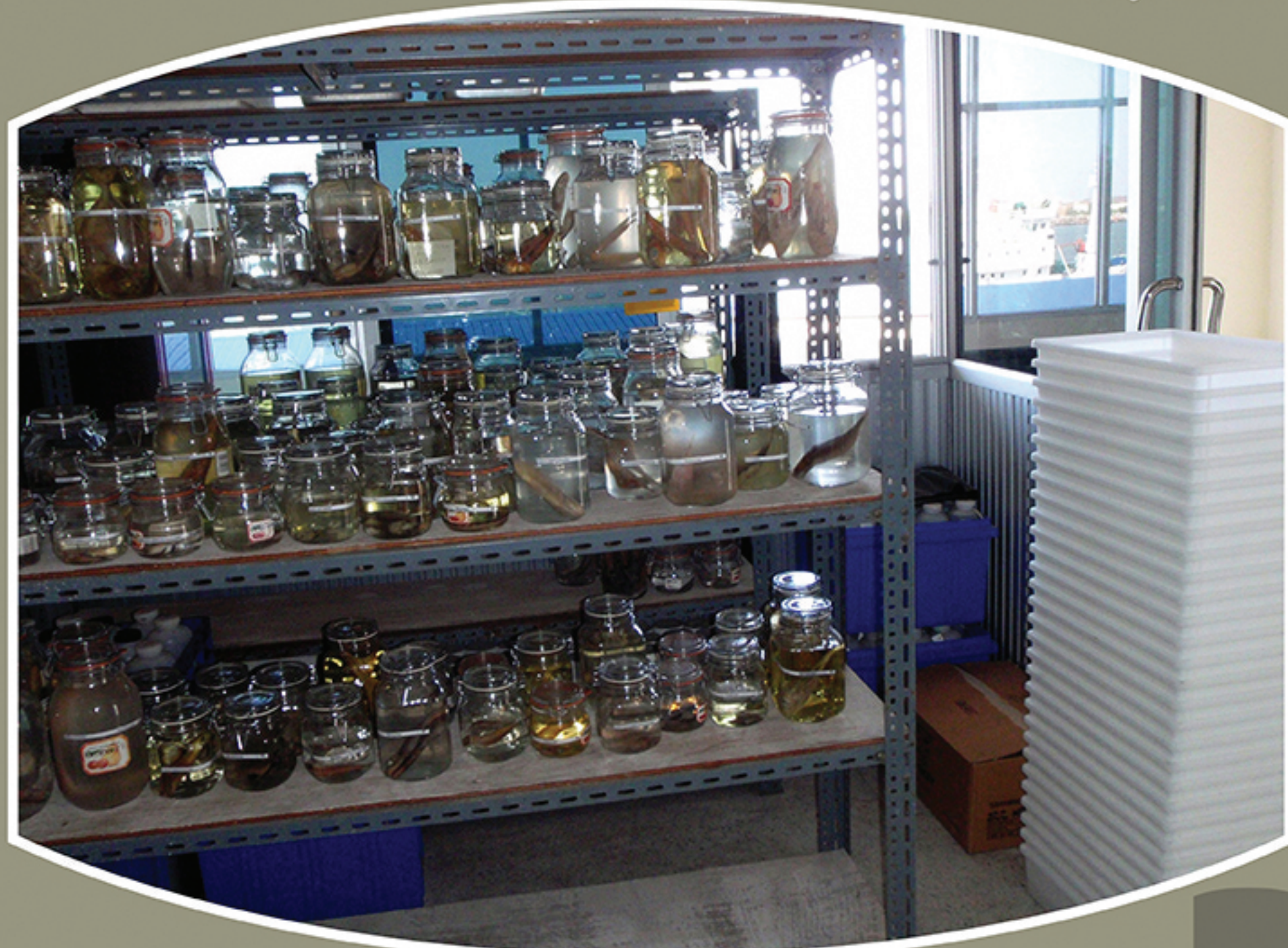
Collection of alcohol preserved fish specimens from the survey deposit at SEAFDEC/TD wet-laboratory