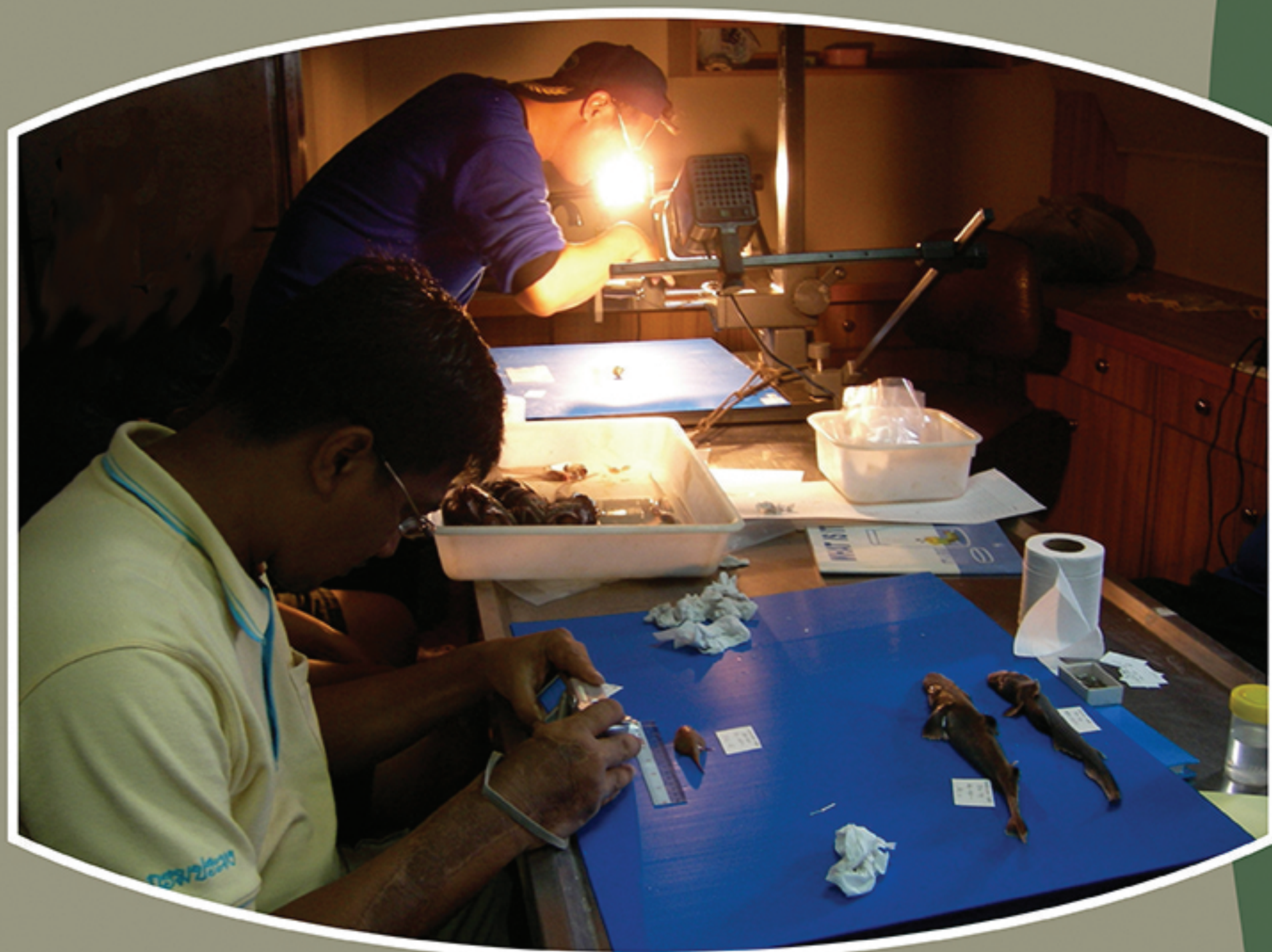
Specimen collection and photography