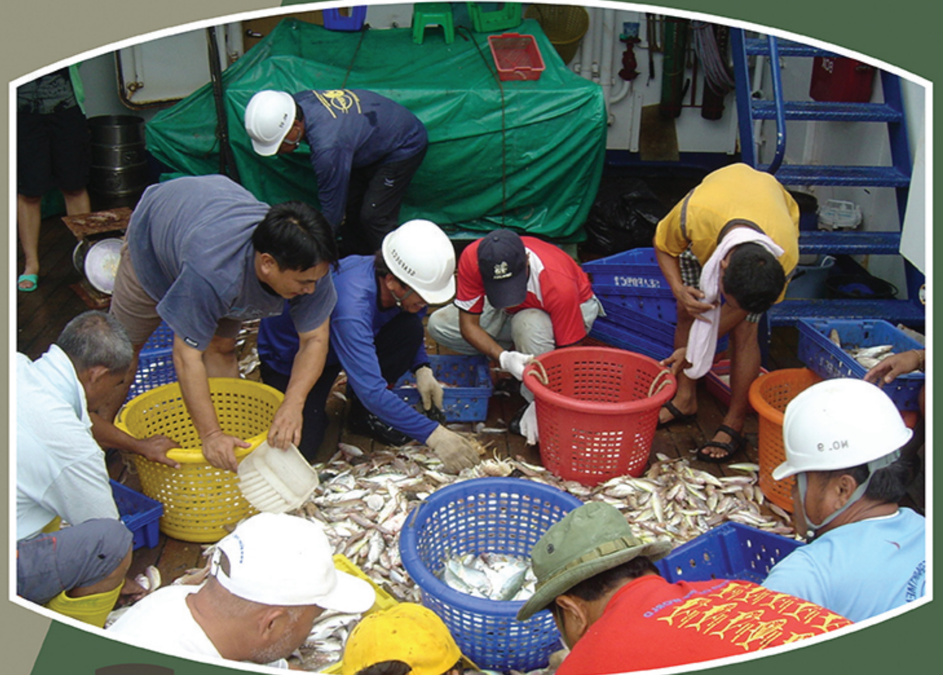
Actual survey at Brunei Darussalam waters in March 2009