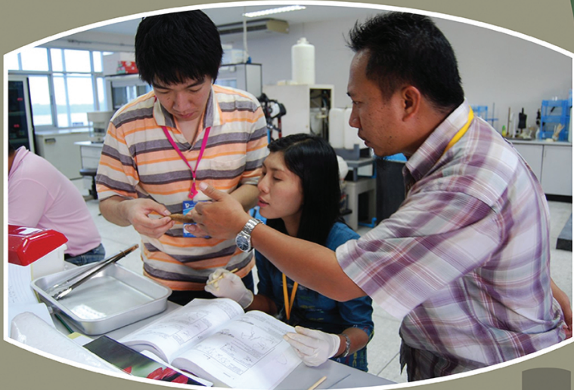
Training workshop on identification of deep-sea fishes on 18-22 January 2010