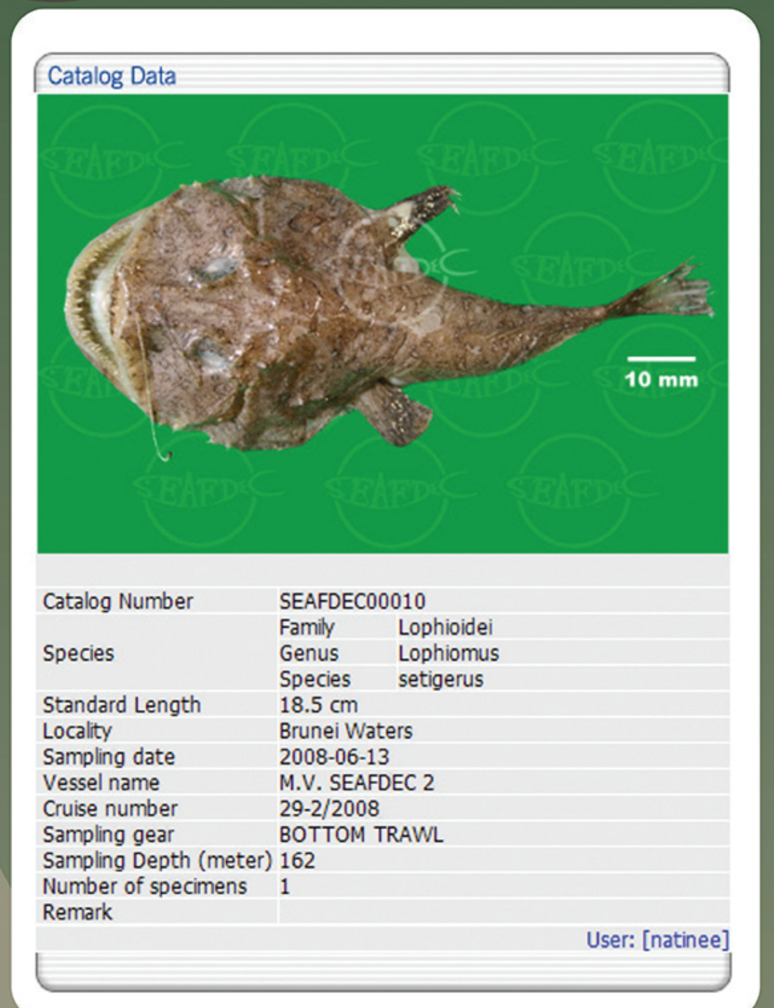
Fish collection database available at http://map.seafdec.org/deep_sea/search.php