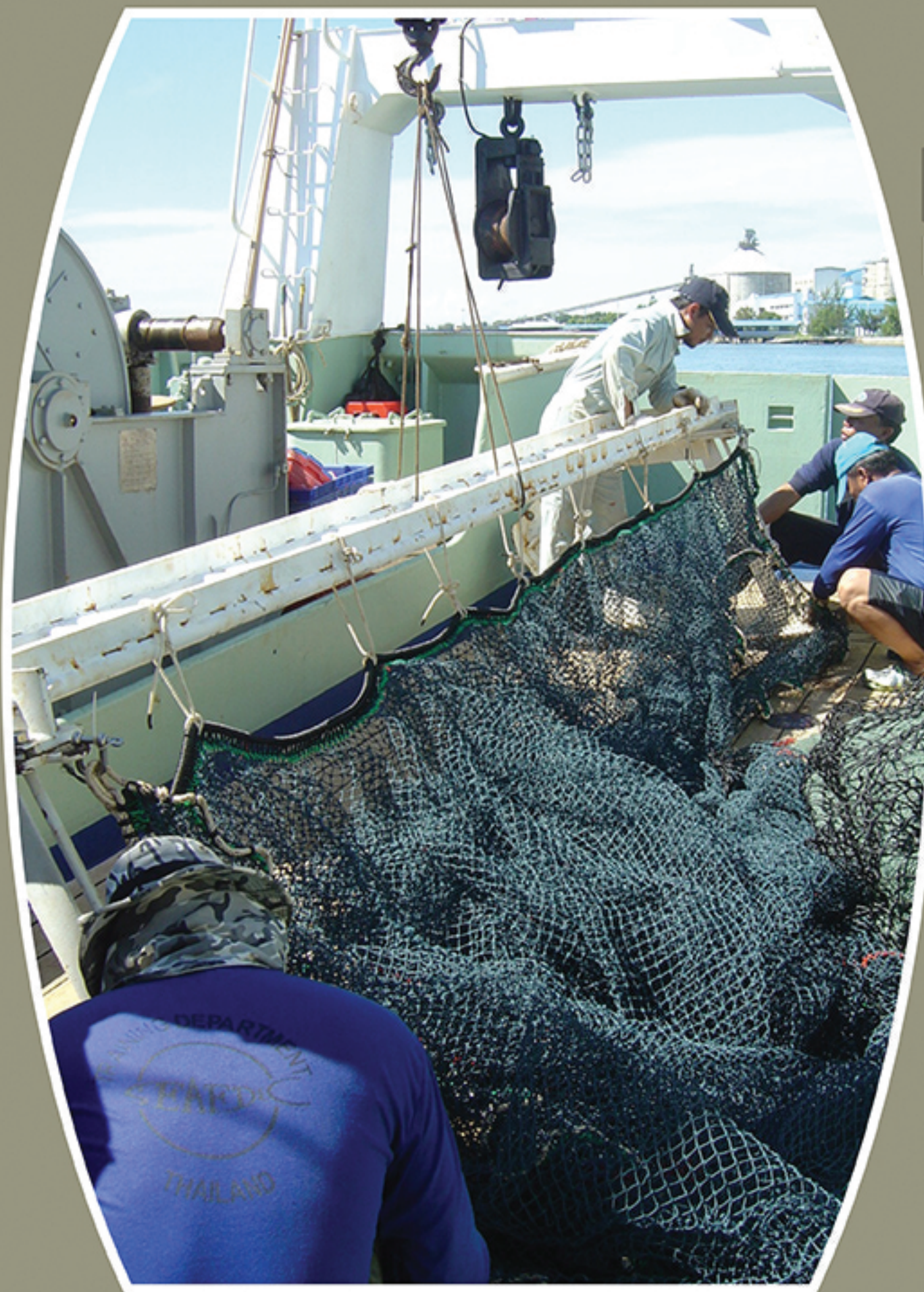
Development and improvement of sampling gear and fishing trial