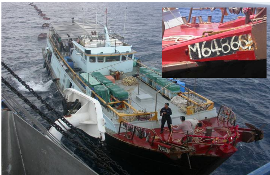
ภาพที่ 6 การจับกุมเรือประมงหมายเลข M64866A สัญชาติจีนฮ่องกง โดยยามชายฝั่งฟิลิปปินส์ (Philippine Coastguard) ขณะเรือลำดังกล่าวทำการประมงบริเวณแนวปะการัง Mangsee Island ในเขตเศรษฐกิจจำเพาะ ตอนใต้ของประเทศฟิลิปปินส์