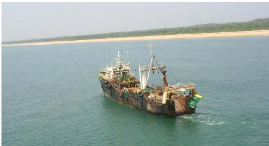
ภาพที่ 2 เรือประมงอวนลากหน้าดินขนาดใหญ่ขณะเตรียมการลักลอบทำการประมง สังเกตจากการเปิดหน้าแผ่นตะเฒ่าซึ่งเป็นการขึ้นตอนการเตรียมกู่ หรือ ทำการปล่อยอวน ภาพถ่ายบริเวณชายฝั่งประเทศแกมเบีย

การทำประมง IUU จะส่งผลกระทบต่อรายได้ของชาวประมงในชุมชนประมงขนาดเล็ก กลุ่มประมงพื้นบ้านในประเทศกำลังพัฒนา โดยการประมง IUU ส่งผลกระทบต่อรายได้ที่จะลดลง ส่วนรายจ่ายและต้นทุนการทำประมงจะมากขึ้นจากการที่ประชากรสัตว์น้ำลดลง คุณภาพของสัตว์น้ำลดลง โดยอาจมีสัดส่วนสัตว์น้ำที่ขนาดเล็กกว่าขนาดมาตรฐานตลาดมากขึ้น ตัวอย่างเช่น ประเทศโมซัมบิก ซึ่งการทำประมง IUU ส่งผลประชากรสัตว์น้ำลดลง อีกทั้งได้ทำลายเครื่องมือประมงของชาวประมงพื้นบ้านและชาวประมงขนาดเล็ก ซึ่งจะมีผลกระทบโดยตรงต่อวิถีชีวิตชาวประมงรวมทั้งชุมชนของชาวประมงท้องถิ่น