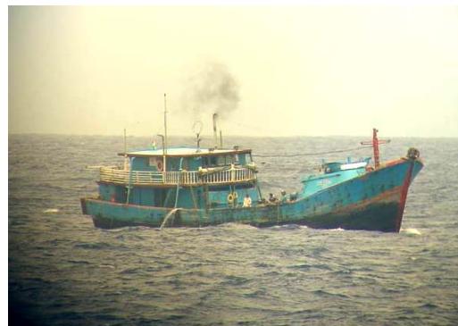
ภาพที่ 11 เรือเบ็ดราวปลาทูน่าสัญชาติจีนไต้หวัน (ซ้าย) และอินโดนีเซีย (ขวา) แม้จะเข้าข่าย การประมง IUU แต่เนื่องจากความตกลง FAO Compliance Agreement 1993 และนโยบายการ จัดการทรัพยากรปลาทูน่าของ IOTC ที่มีได้เฟื่องเสียงการทำประมงเบ็ดราวปลาทูน่าด้วยเรือที่มี ขนาดความยาวไม่เกิน 24 เมตร ทำให้เรือกลุ่มนี้ไม่ถูกควบคุมการทำประมงอย่างเข้มงวดโดย IOTC ในบริเวณมหาสมุทรอินเดีย ที่มา: พิษณุ, 2007