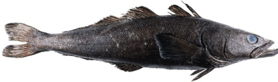
ภาพที่ 1 Patagonian Toothfish ( Dissostichus eleginoides )

Conservation of Antarctic Marine Living Resources: CCAMLR) รายงานผลผลิตจากการทำประมง IUU ในเขตมหาสมุทรซีกโลกใต้ (Southern Oceans) ว่ามีปริมาณสูงถึงร้อยละ 39 ของผลผลิตทั้งหมดในปี พ.ศ. 2543 และ พ.ศ. 2544 ทำให้ประชากรปลาบางชนิดลดลงถึงร้อยละ 90