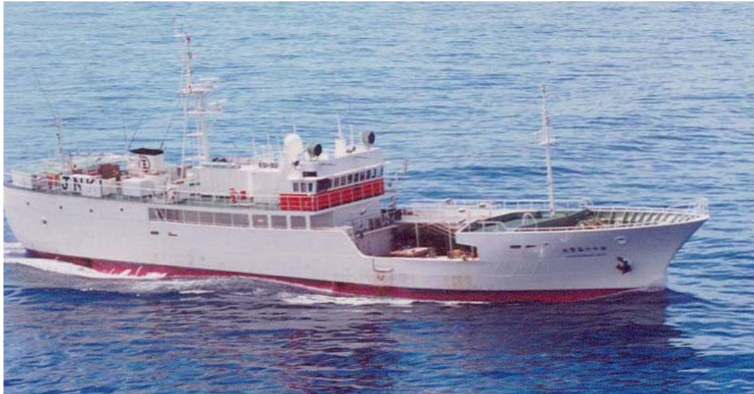
ภาพที่ 10 เรือเบ็ดราวปลาทูน่า ความยาวเกิน 24 เมตร ที่ถูกควบคุมการทำประมงอย่างเข้มงวด โดย IOTC ในการทำประมงบริเวณมหาสมุทรอินเดีย